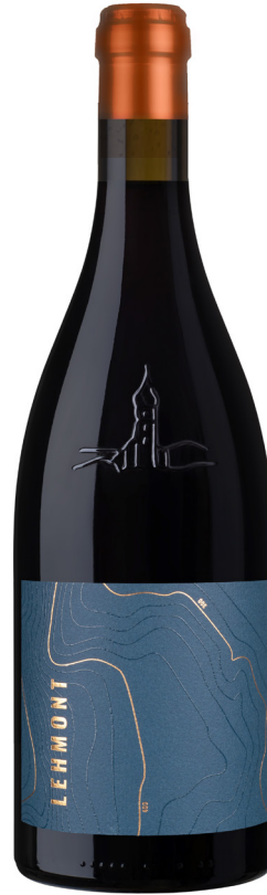
LEHMONT PINOT NERO RISERVA BLAUBURGUNDER RISERVA