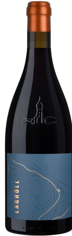
LAGRÖLL LAGREIN RISERVA