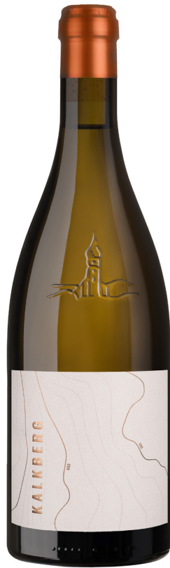
KALKBERG PINOT BIANCO WEISSBURGUNDER