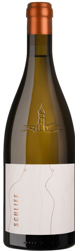
SCHLIFF SAUVIGNON BLANC